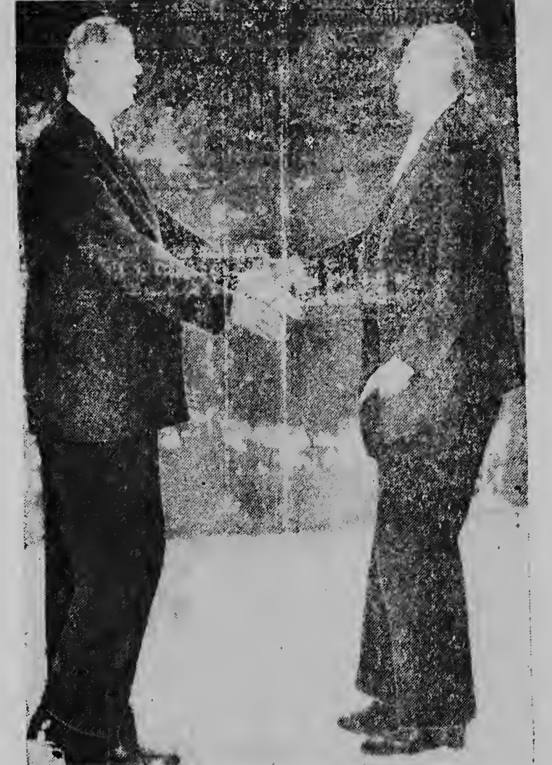
BON JOUR en GUT TAG. — De Franse Premier Charles de Gaulle (links) begroet West-Duitslands kanselier Konrad Adenauer te Colomby-les-deux-Eglises, De Gaulle's woonplaats in Frankrijk.

Vooralnog ziet de commissie echter voor de overheid geen andere taak dan het verstrekken van voorlichting omtrent de wijze, waarop in binnen- en buitenland co-partnership — en certificaatsystemen worden toegepast en de ervaringen welke dienaangaande werden opgedaan.